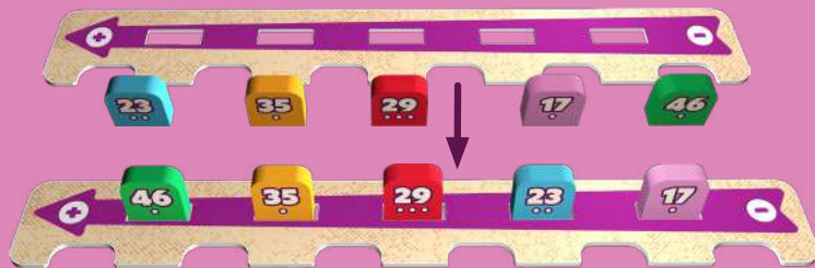
Приклад розташування 5 плиток у підставці за порядком чисел

Г. Насамкінець один гравець бере по 1 випадковій плитці кожного кольору й кладе їх горілиць біля запасу.